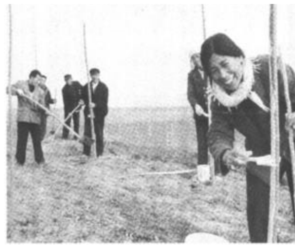
入冬以来，牛庄镇在沿辛河路两侧100米内，按照“统一规划、统一打点、统一购苗、统一栽植、统一管理”的原则大力发展经济林和生态林网建设，截至目前栽植优质速生杨4万多株。