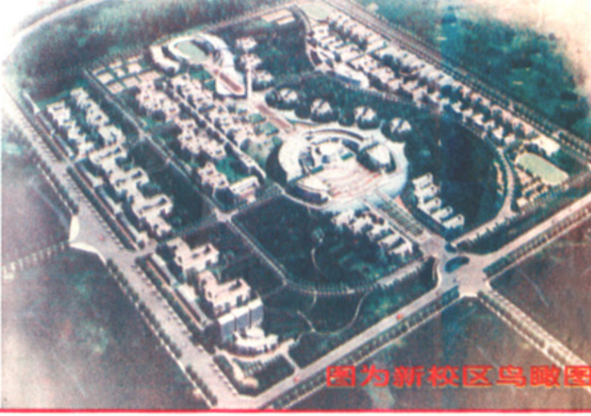
图为新校区鸟瞰图

淄博职业学院新校区坐落在淄博新区内,处在济青高速公路以南、滨博高速公路以西,占地面积3000亩。新校区的总体设想是:高起点、高标准、高质量,建设全国一流职业学院所必须具备的硬件设施,突出森林式特色,形成淄博城市建设的亮点。在建设过程中遵循可持续发展的原则、开放型原则、生态型原则。学院通过面向国际进行新校区规划设计方案竞赛,深圳建筑设计研究总院、上海高等教育建筑设计研究院、上海同设建筑设计院、英国RMTM设计公司等四家公司参赛,深圳建筑设计研究总院的设计方案获一等奖。新校区将在一等奖方案的基础上经进一步修改完善后进行实施,并于今年年底或明年年初动工,到明年9月份将进驻5000学生。