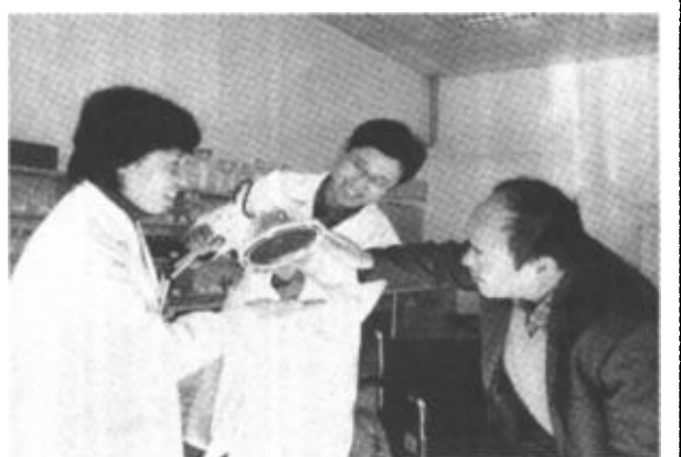
胜利油田中心医院泰恒医疗器械中心成立一年来，严格执行国家医疗器械管理条例，确保了家庭或临床需求，受到了社会各界的普遍赞誉。图为工作人员为患者讲解医疗器械的使用常识。

入冬以来，该乡抽调由四名专职教师组成的科普宣传队，分赴西秦、石村、北贾等特色种养集中的村，利用黑板报、电教片等多种