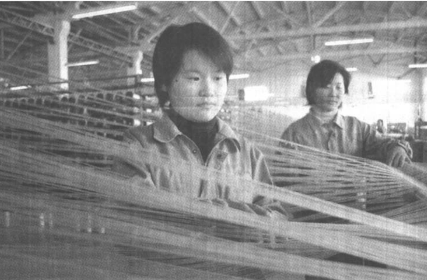
广饶县稻庄镇注重企业技术改造和固定资产投入。今年以来，全镇共新上技术改造投资项目9个，其中西水集团华布布业有限公司年产6000万吨浸胶帘子布项目工艺填补国内空白。

在“情”字上，要带着深厚的感情对待百姓，对损害百姓利益、破坏社会稳定者要无情打击；在“钱”字上，要坚持“多予少取”的原则，千方百计扶持群众，帮助他们解决增收问题；在“难”字上，对困难群众、鳏寡孤独、受灾群众，要集中精力搞好帮扶，安排好他们的生产生活；在“权”字上，办事要公开、公正、公平，维护好群众合法权益。（冯孝亭 张保华）