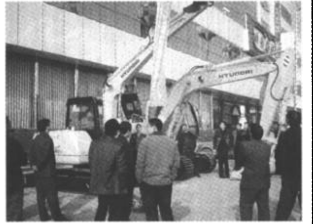
“韩国现代重工机械将大规模、正式的进入东营市场”，这是记者11月23日在现代集团第一次“挖掘机、叉车展示会”上得到的信息。图为与会代表在参观参展机械。